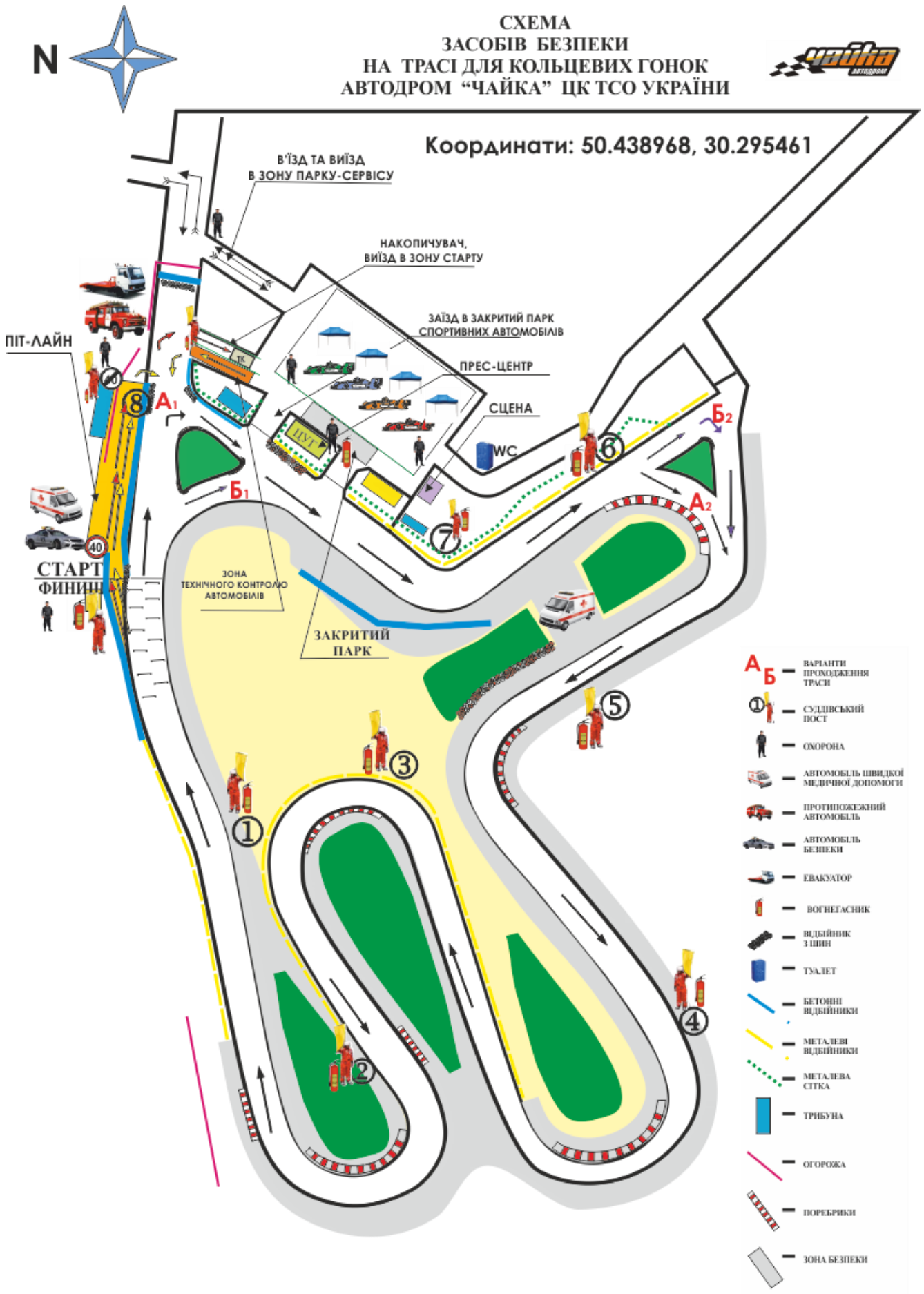
СХЕМА ТРАСИ ЗМАГАННЯ